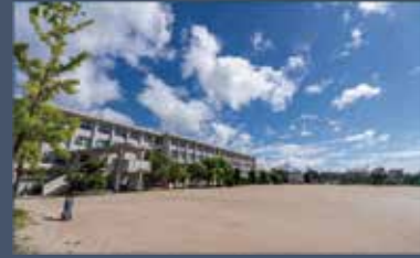
▲ 本館校舎と広いグラウンド

池田高校では「制服」ではなく「標準服」制度を採用しています。どのような服装が高校生活や学習の場に臨むのにふさわしいのか、一人一人が考えて行動しています。