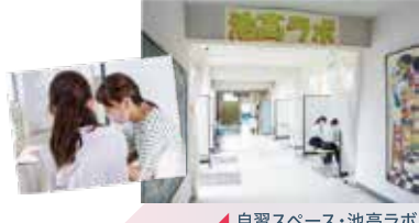
自習スペース・池高ラボ