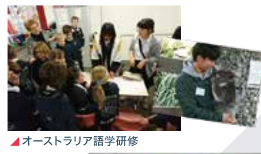
オーストラリア語学研修