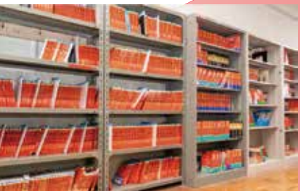
「赤本」約1,500冊などの資料を備える進路閲覧室

進路閲覧室では、自分の進路に関する必要な情報を入手できるよう、各大学の資料や過去の入試問題、進路を考える上で有益なデータを数多く揃えています。